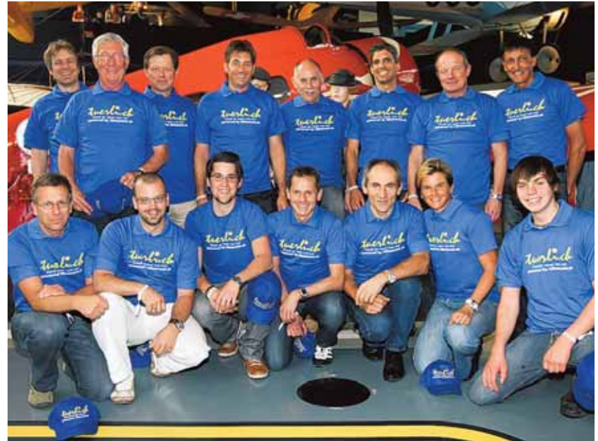
Hochmotiviert am Start zur Jungfrau-Stafette: Das Tuerli.ch – Team

Der Countdown läuft. Der Starttermin zur Jungfrau-Stafette rückt unerbitlich näher! Am Samstag 5. Juni ist es soweit. Im Morgengrauen fällt am Rheinflall der Startschuss zum grossen Rennen quer durch die Schweiz. Die erste Steigung passieren die Radfahrer zu Fuss, die 300 Treppenstufen vom Känzeli hinauf zum Schloss Laufen, wo die Velos parkiert sind. Motivierte Hobbyrennfahrer und Eliteamateure jagen aktuelle und ehemalige Radprofis durchs Zürcher Weinland auf den Flugplatz Dübendorf. Dreizehn weitere Etappen in den verschiedensten Disziplinen folgen sich bei dieser ein-